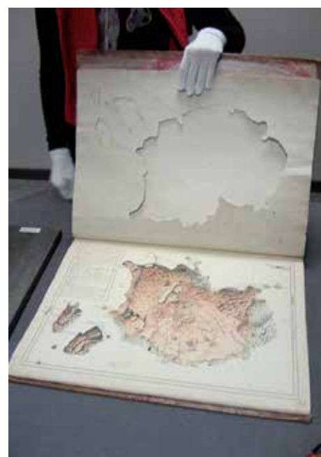
Riksarkivets fantastiska topografiska kartor i utskurna dimensioner