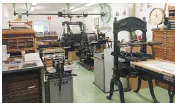
Bild från tryckerimuseet.