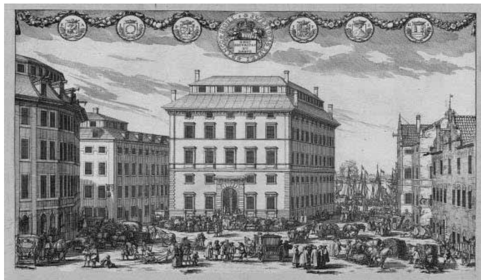
1680 - Första egna huset. Riksbankens Ständers Bank (Riksbanken) flyttar in i Södra Bankohuset på Järntorget i Gamla stan. Huset, som fortfarande finns kvar, är ritat av Tessin d ä.

succé, men sedan Palmstruch givit ut för många sedlar som resulterade i osäkra lån upphörde Stockholms banco med en bankkrasch. Palmstruch avsattes och dömdes till döden men benådades. 1668 tog staten över bankverksamheten genom att 1668 bilda Rikets Ständers Bank , senare kallad Sveriges Riksbank, som från början hade tjugo anställda. I slutet av 1600-talet öppnade riksbanken avdelningskontor i Göteborg, Falun och Örebro. Numera har vi bara kreditpengar; varken sedlar eller mynt har något egentligt substansvärde som motsvarar det belopp de representerar. Alltsedan 1904 har Riksbanken