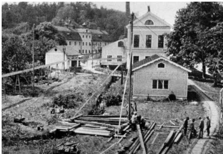
1755 - Tumba bruk grundas. Riksbanken vill sätta stopp för falska sedlar. Ett sätt är att tillverka papper som är svårt att kopiera. Därför startar banken Tumba pappersbruk.

1904 har ensamrätt till sedelutgivning i Sverige. Sedan 2001 drivs Tumba Bruk av det amerikanska företaget Crane & Co som sedan slutet av 1800-talet tillverkar papperet till de amerikanska dollarsedlarna. I juni 2005 invigdes Tumba Bruksmuseum i tre nyrenoverade hus på bruksområdet i Tumba. Tumba Bruksmuseum har, förutom en heltäckande sedelutställning, konferenslokaler som är möjliga att hyra. När Tumba Bruk fyllde 250 år uppmärksammades detta av Riksbanken genom att ge ut en minnesedel. Tumba Bruksmuseum är en del av Kungliga Myntkabinetet, Sveriges Ekonomiska Museum som samarbetar med Riksbanken om denna verksamhet.