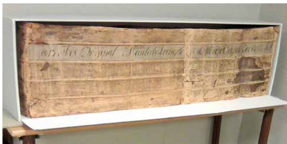
Riksarkivets och veterligt världens då största helinbundna mantalslängd 1813.

sig insikten att skriva denna roman som alltså nyligen publicerats. Den utgör en väl förankrad kavalkad av historiskt belagda händelser och personligheter men med romantiserade rumsbeskrivningar och dialoger, ett välfunnet koncept att framföra "torra historiska fakta" men med en ekvilibristiskt välskriven och lättillgänglig språkdräkt! Ett nytt "hemligt" bokprojekt är under stöpning, inspirerat av den framgångsroman debuten fört med sig. En avrundande dedikationsstund med förvärv av romanen "rensade bordet"!