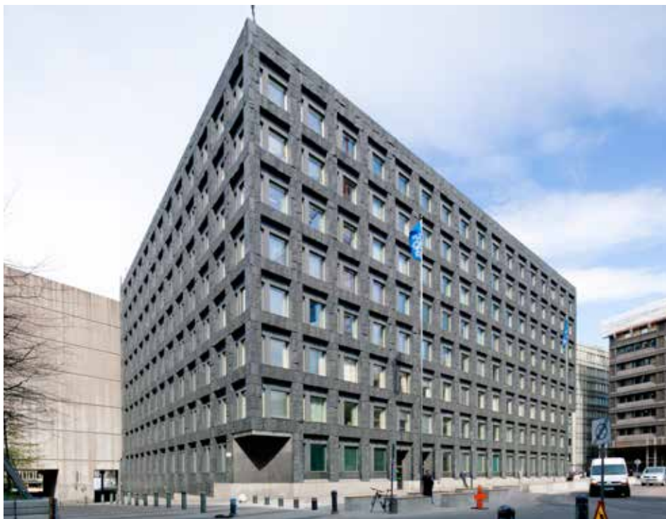
Riksbankshuset i dag. Det tog sex år innan huset som ritats av arkitekten Peter Celsing stod klart. Den 8 april 1976 var det dags att flytta in i den svarta granitbyggnaden vid Brunkebergstorg i Stockholm.

* Riksbanken kommer under hösten 2018 att hålla öppet hus i huvudkontoret på Brunkebergstorg. * En jubi-